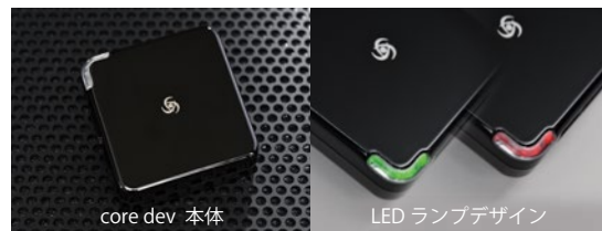
core dev 本体